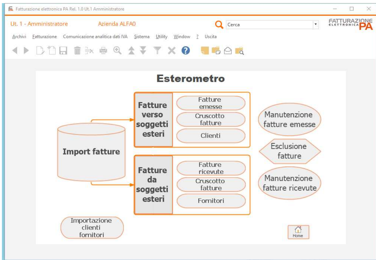
Fig. 2 – Visual mask – Esterometro

Come già per il CADI l'esterometro si caratterizza per la comunicazione di documenti emessi e ricevuti, in questo caso solo da soggetti stranieri, e la gestione in Fatel prevede l'introduzione di due nuovi codici processo: